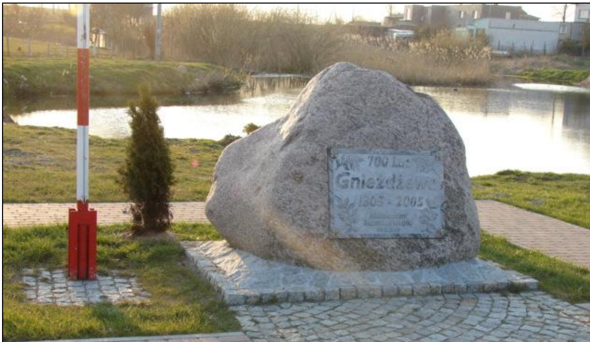
Pomnik 700-lecia Gnieźdżewa

Dla uczczenia rocznicy 700-lecia Gnieźdżewa Rada Sołecka ufundowała kamień z tablicą pamiątkową, który znajduje się nad stawem, będącym przedmiotem wielu anegdot na temat życia i obyczajów mieszkańców wsi.